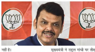
उन्होंने कहा, देविण, वोटर को सांसद के आगे का जवाब देना होगा।

लोकसभा में नेता प्रतिपक्ष राहुल गांधी ने शुक्रवार को महाराष्ट्र विधानसभा चुनाव में मतदाता सूची में धांधली का आरोप लगाया। महाराष्ट्र के मुख्यमंत्री देवेंद्र फडणवीस ने उनके आरोपों को निराधार बताते हुए कहा कि इन मुद्दों पर फिर से चर्चा करने का कोई मतलब नहीं है।