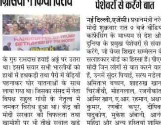
अप्रवासी भारतीयों को हथकड़ी तथा बंधियों पहनाकर लाए जाने का जम्मू में कांग्रेसियों ने किया विरोध