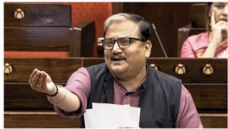
उन्होंने कहा कि साइबिल दरवाजों में इलेक्ट्रिक और आम आदमी के आवागमन का संपर्क है। सरकार को साइबिल उसके

शिक्षा सेवाएं और अन्य बुनियादी सेवाएं भी प्रभावित हो चुकी हैं। उन्होंने कहा कि पूंजी का केंद्रीकरण राजनीति को भी प्रभावित कर रहा है। उन्होंने कहा कि इस स्थिति से निपटने के लिए सरकार को संविधान के प्रावधानों के अनुसार आय का समान वितरण करने की दिशा में काम करना चाहिए। आम आदमी पार्टी के संजीव अरोड़ा ने देश में साइबिल चिंताओं की ओर ध्यान देने का मामला उठाया और कहा कि साइबिल और उसके उपकरणों पर 18 प्रतिशत जीएसटी लगाते हैं जबकि इलेक्ट्रिक साइबिल पर पांच प्रतिशत का प्रावधान है।